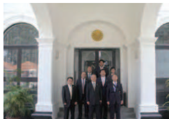
日本大使館を表敬訪問

次に、在スリランカ日本大使館を表敬訪問し、書記官の方や領事の方から、大使館の施設や仕事などについて説明を受けた後、大使の公邸において、在スリランカ日本大使の菅沼大使と会談しました。最後に、今回の視察にもご