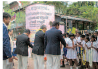
多くの生徒が出迎えてくれました

日本の学校とは違い、6歳からの11学年が1校で学んでおり、生徒数は1千600人を