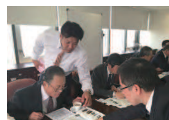
JICA スリランカ事務所にて

尽力くださったチャングシリ高僧が代表を務めるSNECC(スリランカ日本教育文化センター)を視察しました。