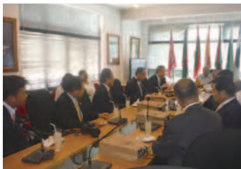
オリンピック委員会にて

ジャヤワルダナ氏の功績を記念するものです。別館の日本会館には、日本画や骨董等の日本文化を伝えるものが所狭しと展示され、日本への関心の高さがうかがえました。