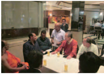
ダヤシリスポーツ大臣と会談

滞在中のホテルにおいて、スポーツ大臣に急遽お会いしました。大臣は翌日から海外出張のため、スポーツ省訪問の際はお会いできないこと