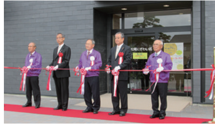
オープニングセレモニーの様子

施設の愛称は『松尾交流センター洗心館』に決定し、10月1日にオープニングセレモニーが行われました。