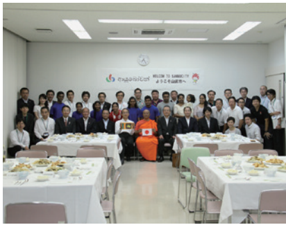
講演終了後の歓迎パーティの様子

氏は、2020年東京オリンピック・パラリンピックにおけるスリランカ国の事前キャンプ招致にあたり橋渡し役として尽力された方で、議会からも議長、副議長ほか